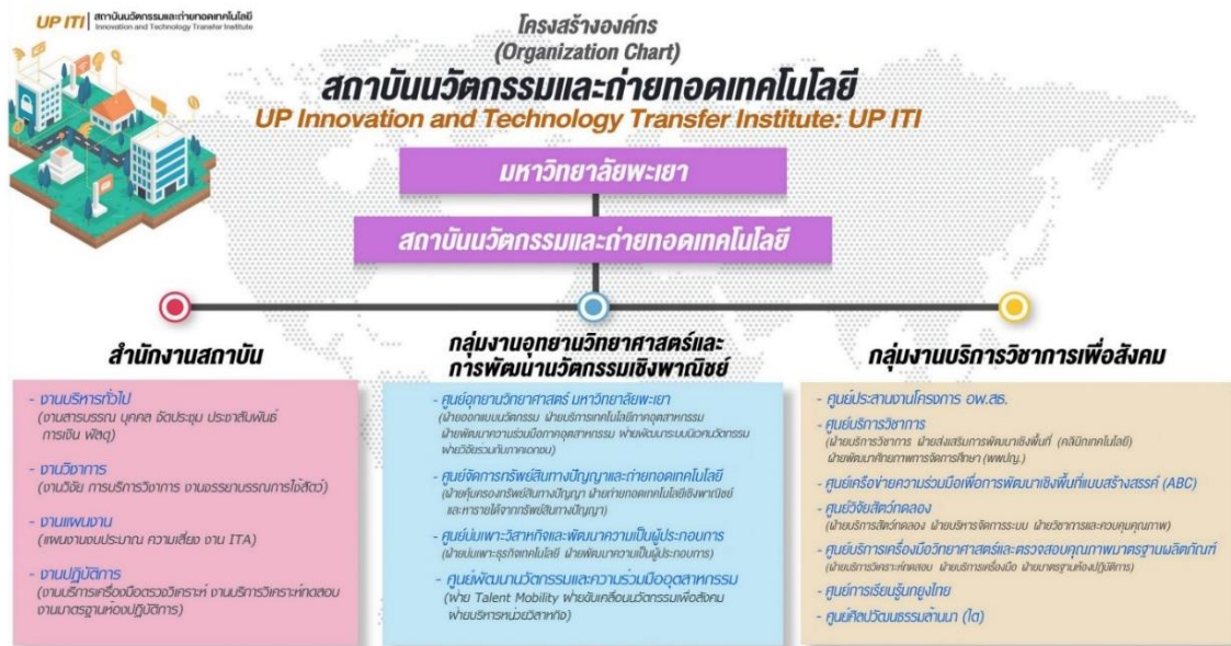
ภาพที่ 1 โครงสร้างองค์กร สถาบันนวัตกรรมและถ่ายทอดเทคโนโลยี มหาวิทยาลัยพะเยา