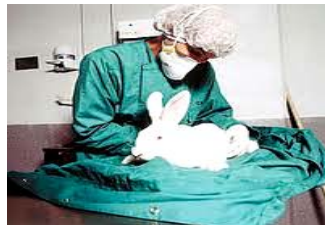
อาคารสัตว์ทดลอง มหาวิทยาลัยพะเยา